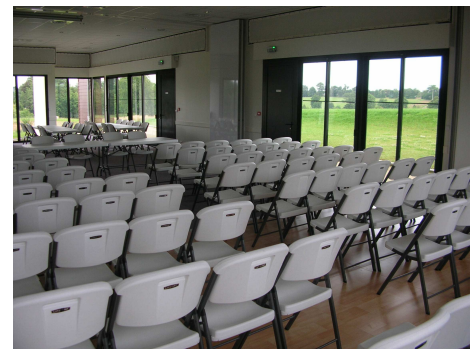
Salle de réception (174 m 2 ) avec accès direct extérieur et chapiteau